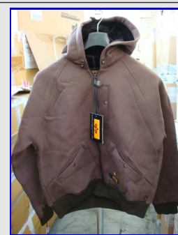
Felpa Termica Uomo Mod. 01 Vintage made in Italy